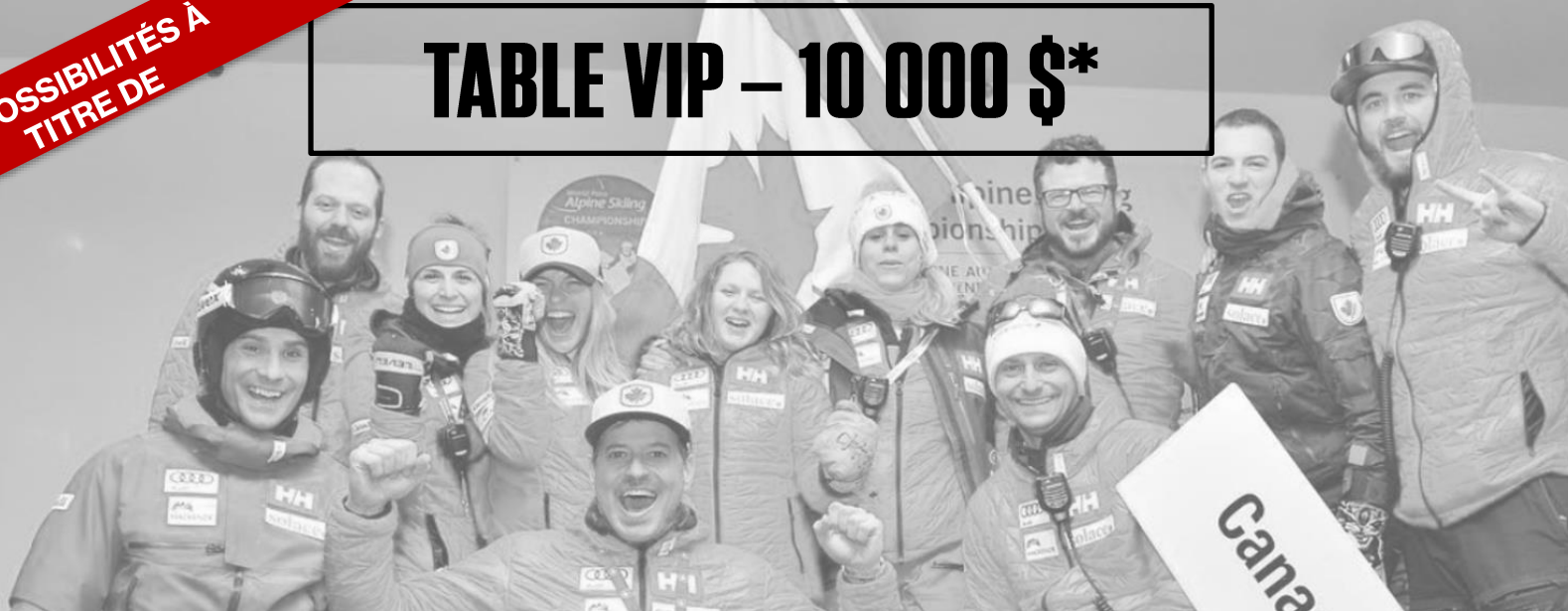
TABLE VIP – 10 000 $*

*Reçu officiel pour dons de charité d'ACA, au moins 80 % du montant contribué. No d'organisme de bienfaisance : 100164995 RR0001