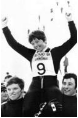
NANCY GREENE RAINE