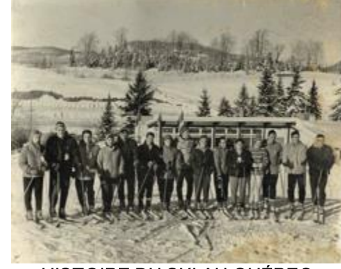
HISTOIRE DU SKI AU QUÉBEC

Fondé sous le nom d'Association canadienne du ski amateur le 20 décembre 1920, Canada Alpin donnera le coup d'envoi à sa saison centenaire en tenant un gala qui réunira la fine fleur du ski alpin, dont de remarquables anciens membres de l'équipe nationale. Cet événement-bénéfice riche en énergie vous donnera la possibilité de redonner aux athlètes ainsi que de soutenir et de rencontrer tous les membres inspirants des équipes canadiennes de ski alpin, de ski para-alpin et de ski cross de la saison 2019-2020.